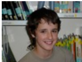
Danel: Bartzelonara eta Port Avenirara