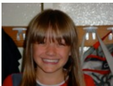
Egilea: Emily Home