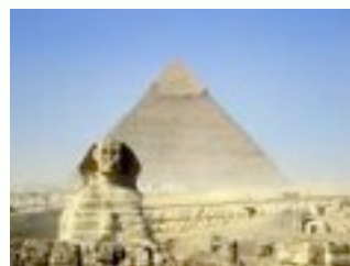
Egilea: Unai Cadenas