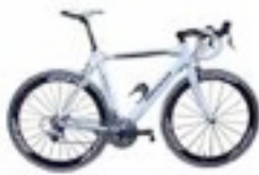
Bicicletas Temporada 2007