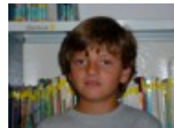
Egilea: iñigo Otaegui.