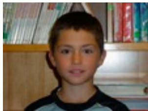
Egilea: Manex Garai