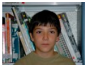
Jon: Beldurrezkoak, komedia.