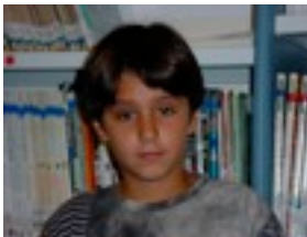
Ander: Beldurrezkoak, komedia.