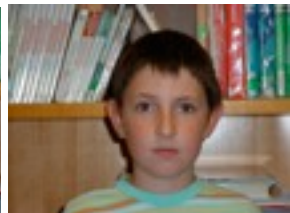
Martin: Ez daki zein motatako pelikulak gustatzen zaizkion.