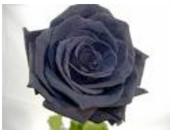
Egilea: Oier Coretti.

Bapatean ahots bat entzun zuen eta hola esaten zuen: -Gaur da azkeneko eguna mundu normalera joateko, bestela txokolatezkoa bihurtuko zara. Orduantxe azaldu zen arrosa misteriotsua eta mundu normalera joan zen.