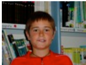
Mikel S: Akziozkoak.