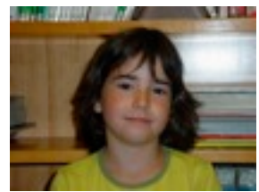
Naroa: Ez daki zein motatako pelikulak gustatzen zaizkion.