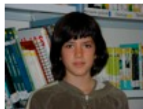
RUTH: Rallitas flacas