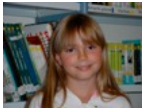
NAIA: Arco iris.