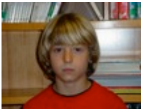
MAÑEL: Ez nintzen egon