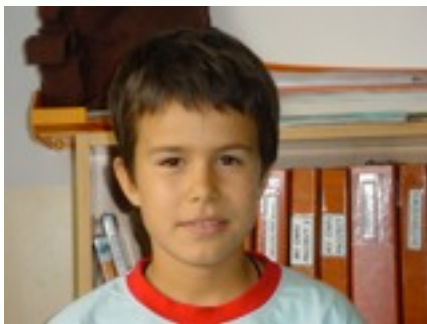
Egilea: JULEN BORGE