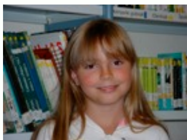
EGILEA: NAIA AZPIAZU