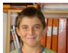
Bittor: PES 2009