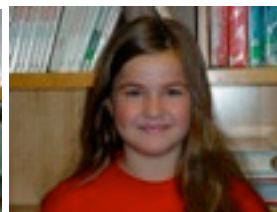
Maialen: Stabiloen estutxea