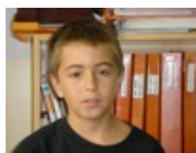
Danel: Saskibaloieko za- patilak