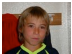
Ibai Q. PSPbat.