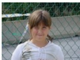
EGILEA: SARA DELGADO