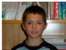
Manex G. Teniseko raketa bat.