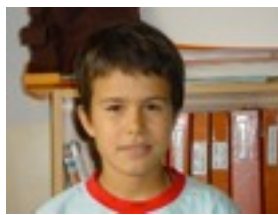
Julen B. Argazki makina bat.