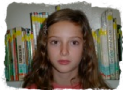
Egilea : Clara Ortiz de Lanzagorta.

Hay un hombre que me persigue con una oveja y escapo lo más rápido posible. Me meto por un pasadizo, me siento nerviosa, tiemblo y corro hasta que me desmayo y al despertar me encuentro en otro sueño. Estoy en una pradera llena de flores y con un paisaje precioso. Noto un cosquilleo en los pies, miro y estoy en arenas movedizas. Miro hacia arriba y me encuentro en un desierto enorme. Siento que voy bajando poco a poco y de repente, cierro y abro los ojos y me despierto.