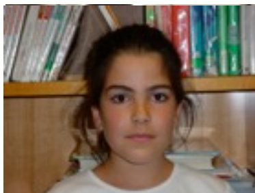
Egilea: Nora Goialde