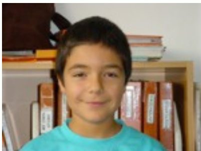
EGILEA: ASIER DELGADO