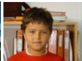
IOSU F. EL CANTO DEL LOCO