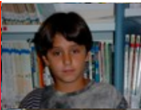
ANDER A. BERRI TXARRAK