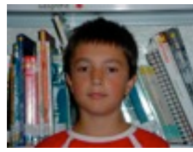
MAÑEL G. BERRI TXARRAK