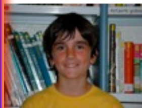
XABI P. ROLLIN STONES