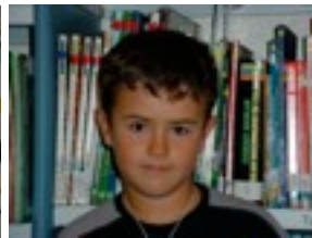
OIER B. BERRI TXARRAK