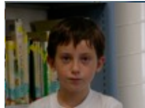
Jon: Linking park