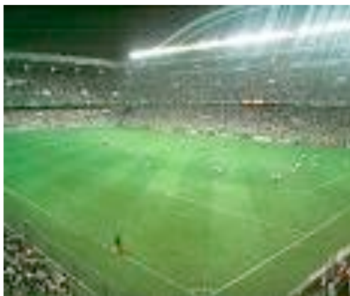
Irune de la Fuente

Ez da bakarrik erabiltzen futbolera jolasteko baita kontzertuetarako ere edo beste ekintzetarako erabiltzen da.