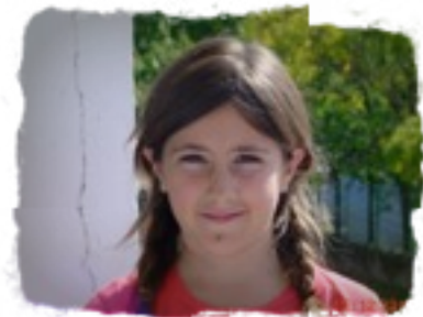
EGILEA: SARA DELGADO