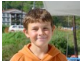
Iñigo: Amaiur eta Ainhoa