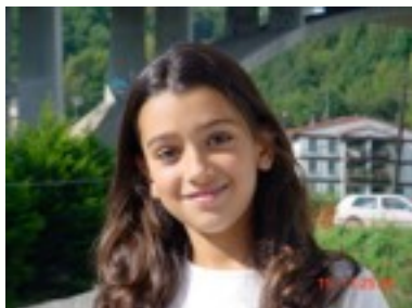
Egilea: Ainhua Del Salta.