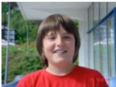
EGILEA: JON GANUZA

Once upon a time in USA ( New york ) lived wasimodo . He has got a short hair and black eyes. He hasn't got a family'. Then wasimodo has a baseball stick. Wasimodo goes to play on the park, all the people were jealous for the baseball stick, because is very beautiful. All the people had a weapon for kill Wasimodo. Wasimodo was upset and began a fight all people. At the end kill ed all people and Wasimodo live happy al thought to be alone.