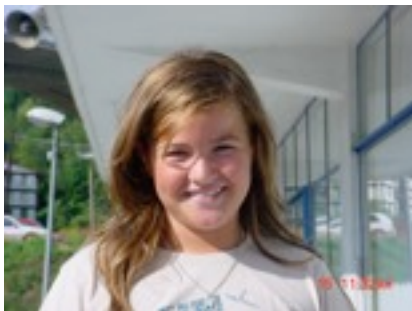
EGILEA: MAIALEN PAVON

Juglik Chimpa lagundu nahi zuen eta sprai bat asmatu zuen, oso asmakari ona zen eta espraia osagai askorekin zuten eta hauek izan ziren: hondarra, lokatza, bi ur tanta eta kaptus barruko isuria. Jugli sprai bukatu orduko Chimpari ahoa irekitzeko eskatu zion, sprai bota zion, sprai oso eraginkorra izan zen eta oso ondo usaintzen zuen. Sprai horrek lagun guztiak gehiago elkartu zituen eta oso ondo bizi izan ziren guztiok.