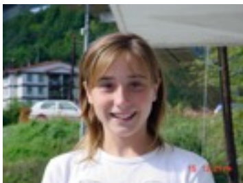
EGILEA: MARIA BALENCIAGA

Askatasunaren Estatuak: Askatasunaren estatua handia da abioian zaudela ikus dezakezu york berrian ,oso garrantzitsua da. Estatu ikustera joan zintezke eta goian zaudela york zentroa ikusten da. Estatuaren forma emakume bat da koro batekin eta esku bat goian duela antortza piztu batekin.