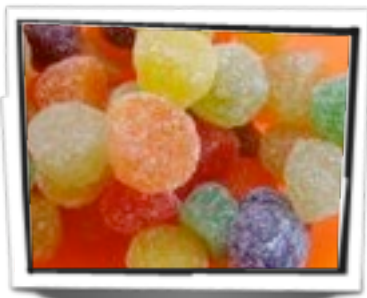
Egilea: Cecilia Arrizabala

Estoy en un lugar en el que hay cosas golosas y saladas a los niños les encanta comerse las. Estoy dentro de una bolsa. cuando hay un cumpleaños todas la tienen. En el patio sacan de ahí las cosas golosas y saladas para comerse las. Los niños nos ponen muy felices cuando nos los dan. Antes del patio, en la clase, recogemos diez minutos antes de lo normal, porque con la tarta se tarda. Luego nos ponemos en fila india y de una en una nos los damos. Huelo cosas dulces aquí adentro. Hay granitos dulces y son blanquitos y pequeñas. Si pisas en cima de ellos te hundes pero no hasta la cabeza como en las arenas movedizas. Me estoy moviendo de un lado a otro, unas veces como un columpio y otras veces estoy dentro de una cosa que se lleva en la espalda.