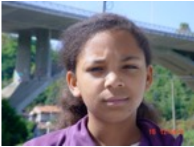
Egilea: Nayeli Contreras