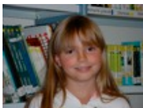
Naia: Nahiko poliki doa.