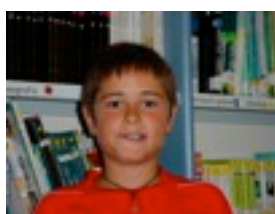
Mikel S : Azkarregi doa.