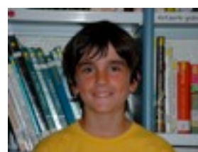
Xabi P: Mantso doa.