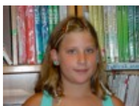
Klara: Oso mantso doa