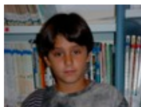
Ander A: Poliki doa.