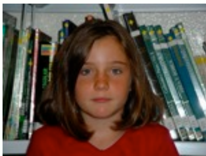
EGILEA: Oihana Etxezarraga